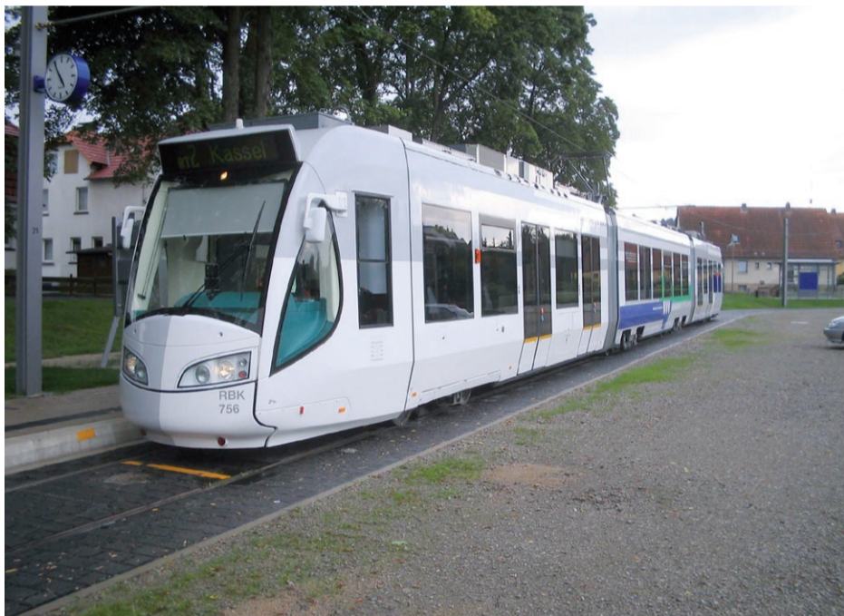
Hoe de regiotram er uit gaat zien is nog niet bekend, dit is een voorbeeld uit Kassel, Duitsland

hier de regiotram gaan rijden. Hoe deze tram er uit gaat zien en, nog belangrijker, wat het traject van deze tram zal worden, is nog niet beslist. De gemeente geeft de inwoners van de stad de mogelijkheid hun meningen en ideeën over de regiotram en het tracé te ventileren tijdens drukbezochte inspraakavonden en –ronden. Hieruit blijkt dat de regiotram leeft in de stad. De ‘Stad- jers’ hebben een uitgesproken mening over het tracé van de tram in de hoop te kunnen profiteren van een maatregel die eigenlijk helemaal niet voor hen is bedoeld. Het gaat er tenslotte om het forensisch verkeer van en naar de stad optimaal te laten verlopen. De gemeente geeft op de website www.regiotram.nl de laatste stand van zaken weer. De site www.tramgroningen.nl , een particulier initiatief waaruit de betrokkenheid van de Groningers blijkt, geeft een ieder de kans zijn of haar mening te uiten over de regiotram.