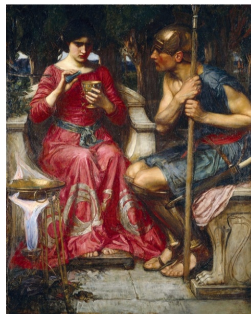
J.W. Waterhouse: Jason and Medea, 1907