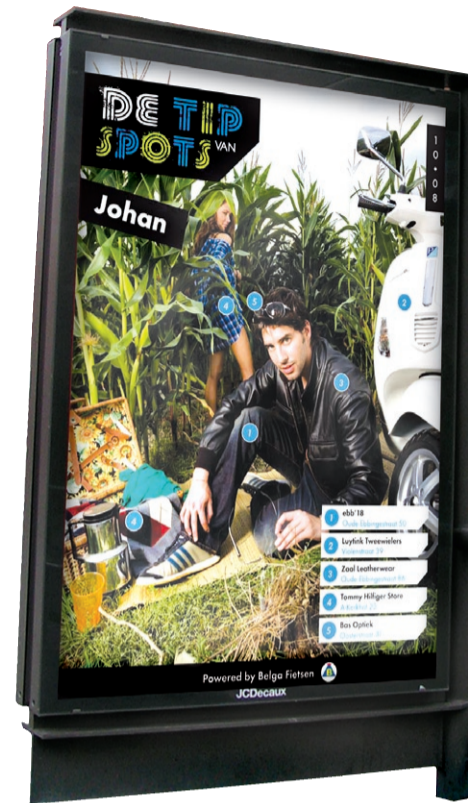
pagne uit te breiden naar andere steden. www.youngenstein.nl

De eerste ‘stijlwijzers’ liggen inmiddels op plaatsen waar de doelgroep is te vinden: bioscopen, restaurants, scholen en discotheken. „De bedoeling is om elke maand een nieuwe campagne te realiseren. Naast mode gaan we ons ook richten op onderwerpen als het pimpen van een auto, of de inrichting van een kamer”, besluit Weelink. Uiteindelijk hoopt Young Einstein de cam-